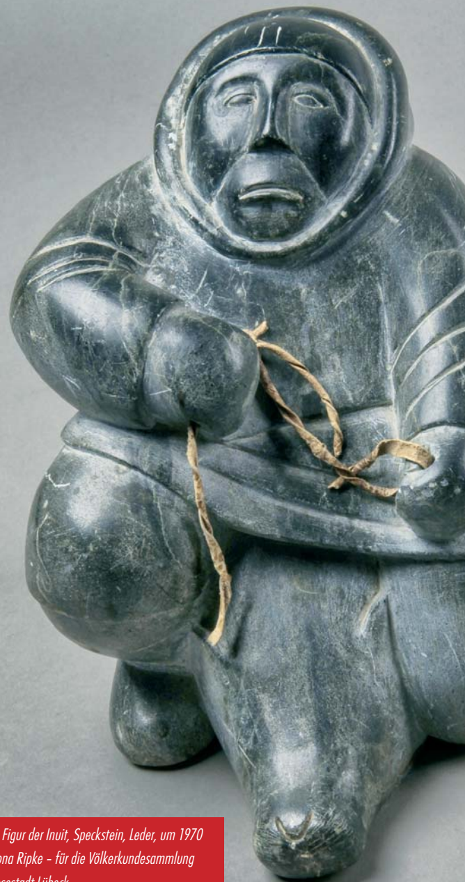
Jäger , Figur der Inuit, Speckstein, Leder, um 1970 Foto: Ilona Ripke - für die Völkerkundesammlung der Hansestadt Lübeck zur Ausstellung „Südwärts“ (März 2020)

Mit dem Kurator Dr. Lars Frähsorge Nur für Mitglieder Anmeldung bis zum 23. März 2020, Tel: 0176 56751000 oder kontakt@geoluebeck.de