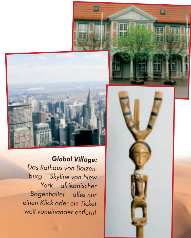
Global Village: Das Rathaus von Boizenburg - Skyline von New York - afrikanischer Bogenhalter - alles nur einen Klick oder ein Ticket weit voneinander entfernt

Gerade in diesen Zeiten der weltweiten Migration und der verstärkten Zuwanderung von Menschen aus allen Kulturen werden diese Objekte immer wichtiger. Denn sie können Brücken schlagen zwischen den Kulturen .